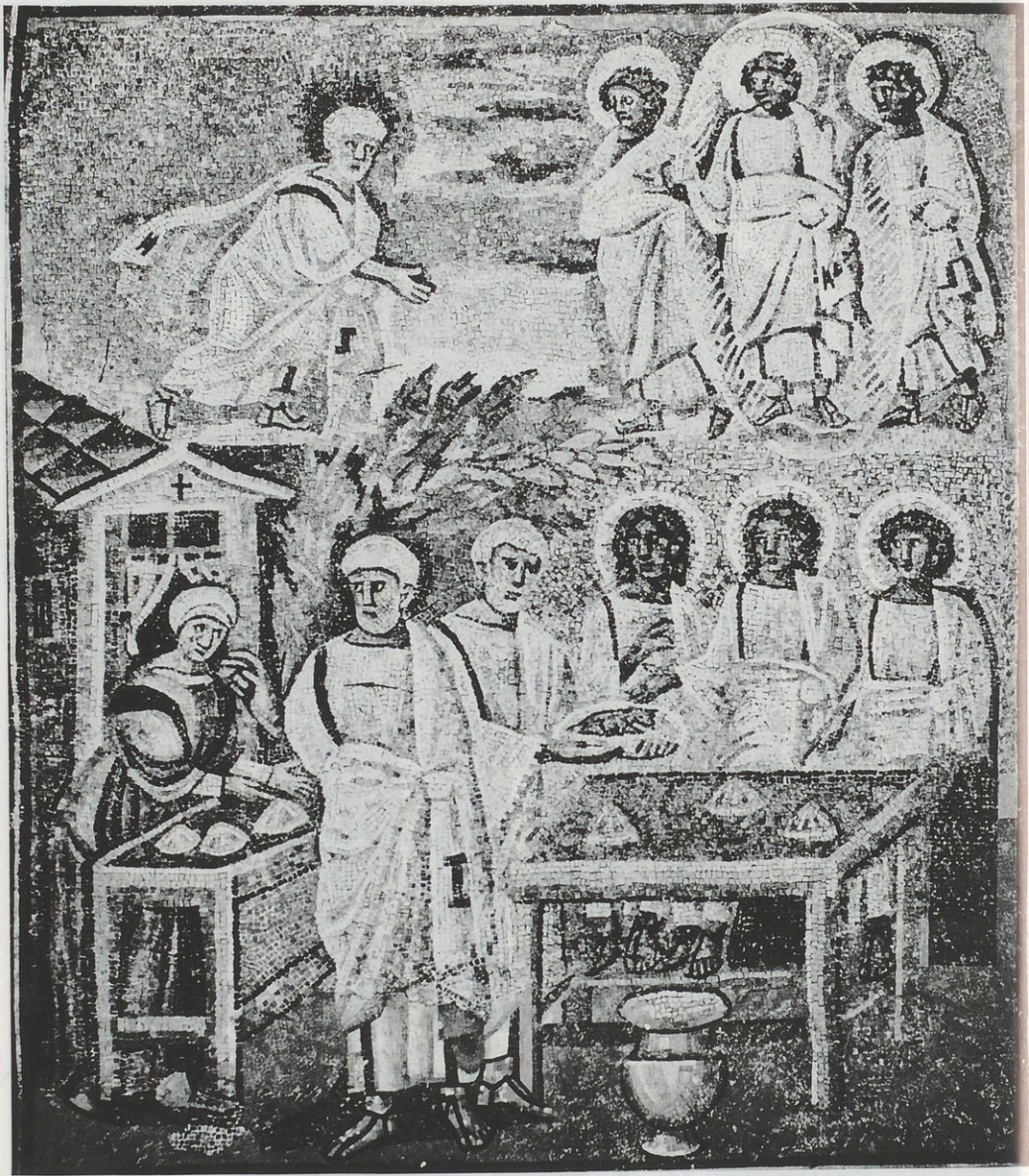
Abb. 2: Rom, Santa Maria Maggiore.