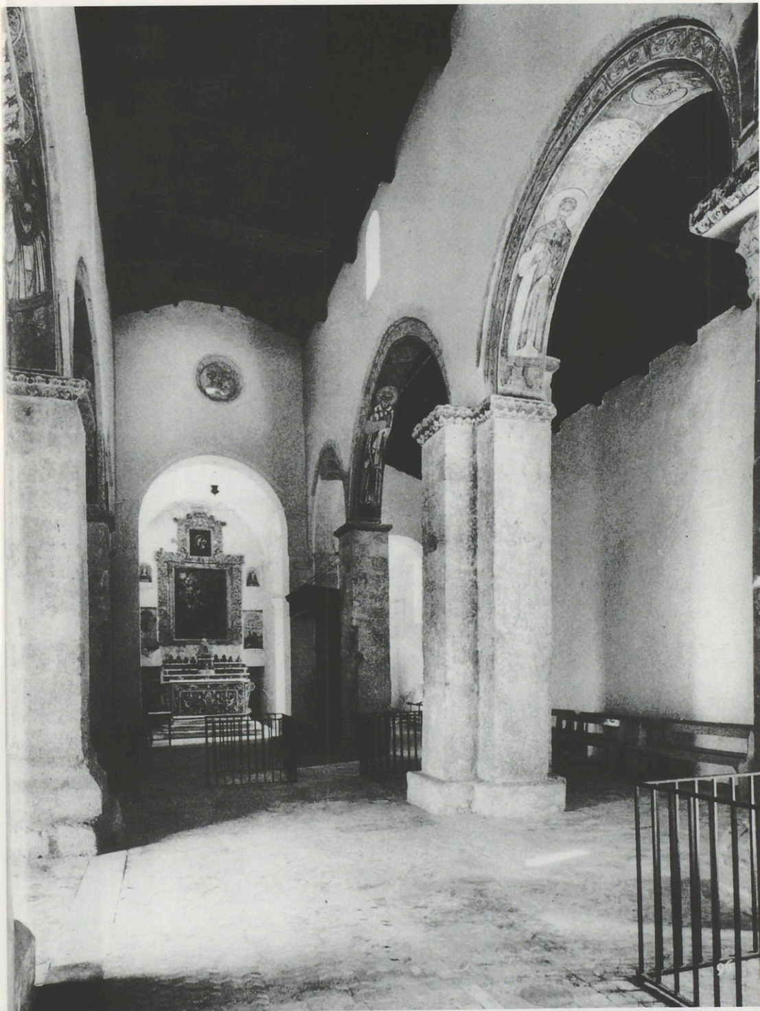
Abb. 6: S. Demetrio Corone, S. Adriano, Inneres.