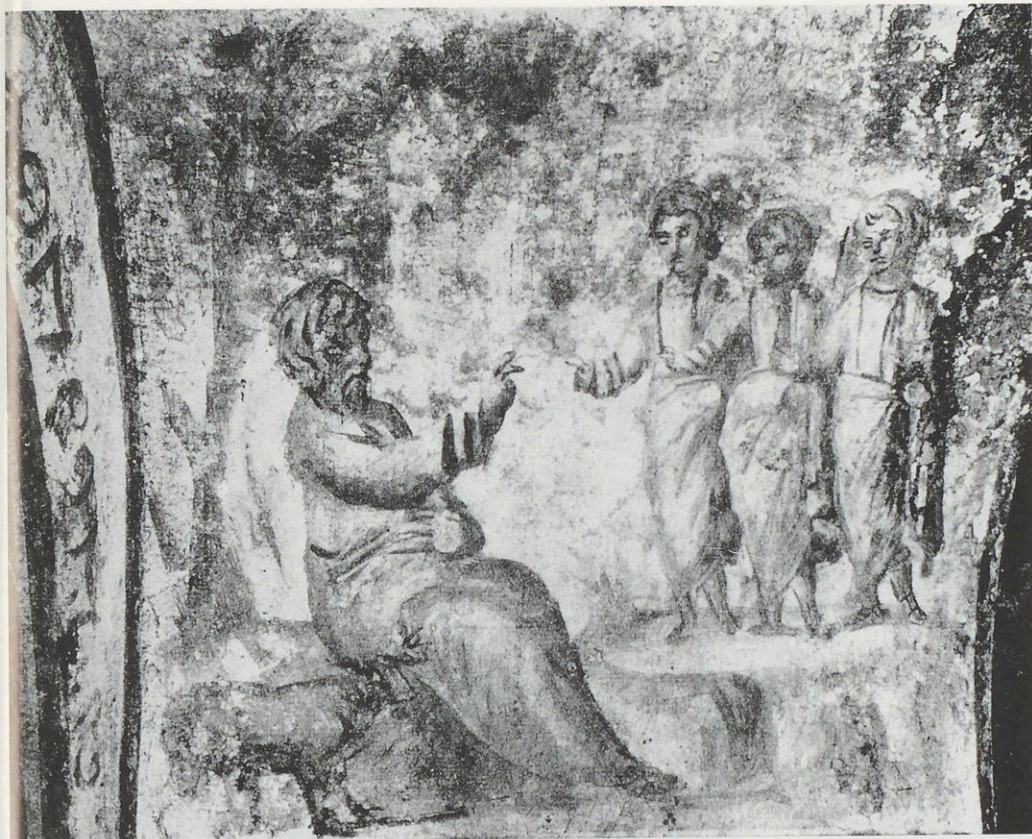
Abb. 3: Rom, Katakombe an der Via Latina.