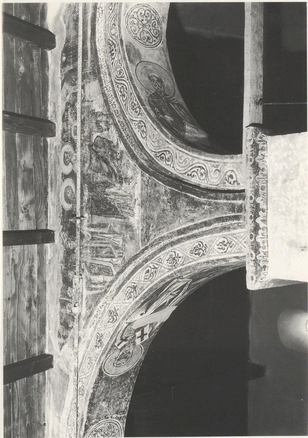
Abb. 8: S. Demetrio Corone, S. Adriano, Timpelgang Mariens.