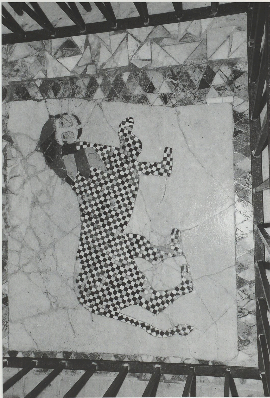
Abb. 7: S. Demetrio Coronae, S. Adriano, Fußboden in opus sectile.