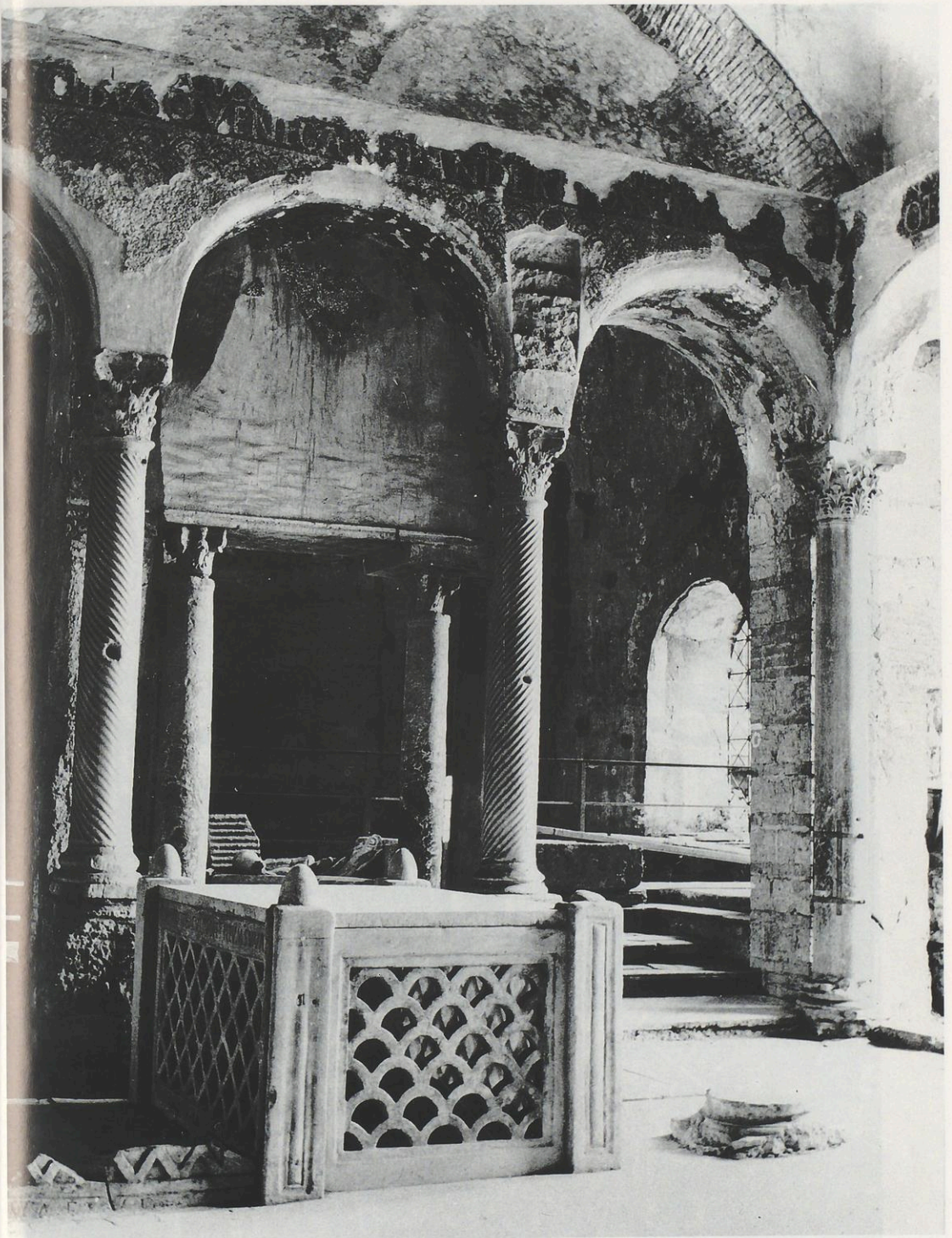
Abb. 1: Cimitile/Nola. Das von den noch teilweise spätantiken Schrankenplatten eingefasste Grab des hl. Felix.