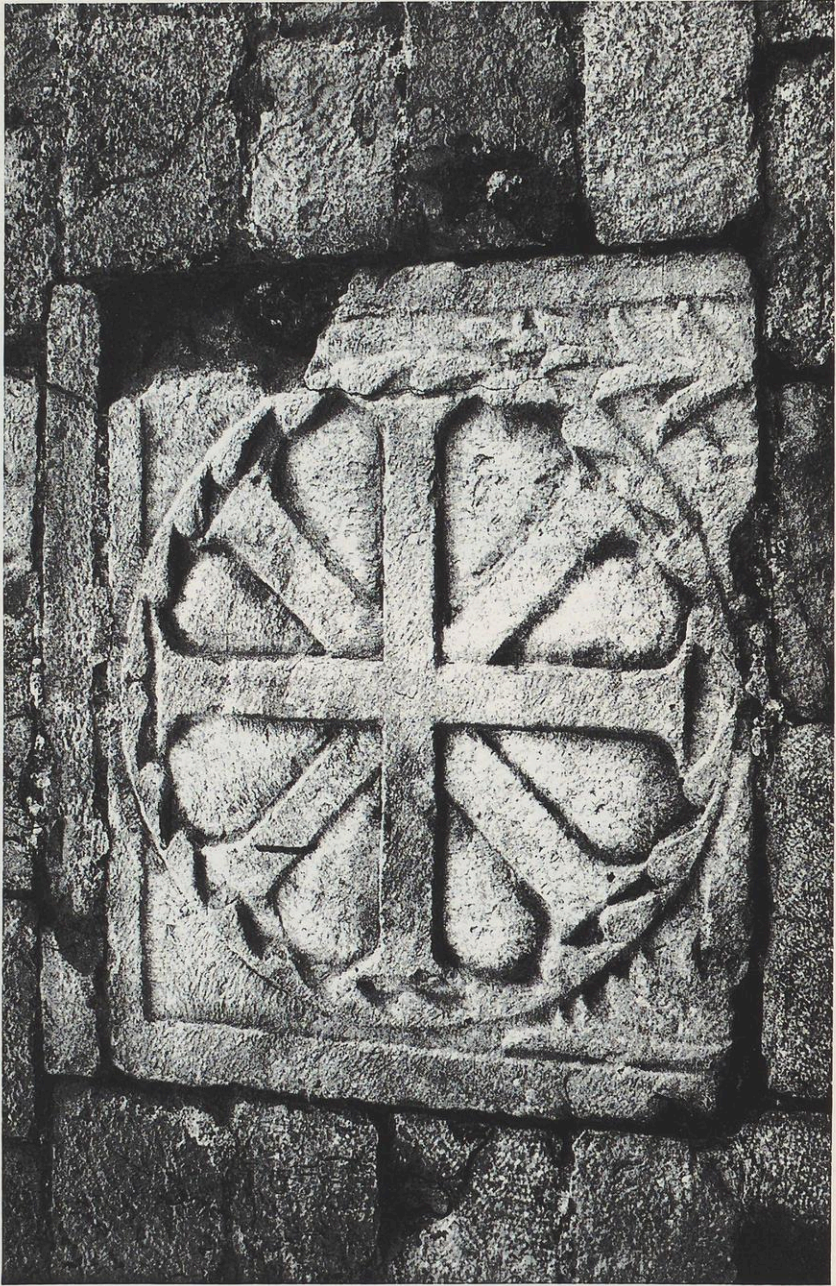
Abb. 3: Marsico Nuovo, Kathedrale: vermauerte Platte einer Chorschanke