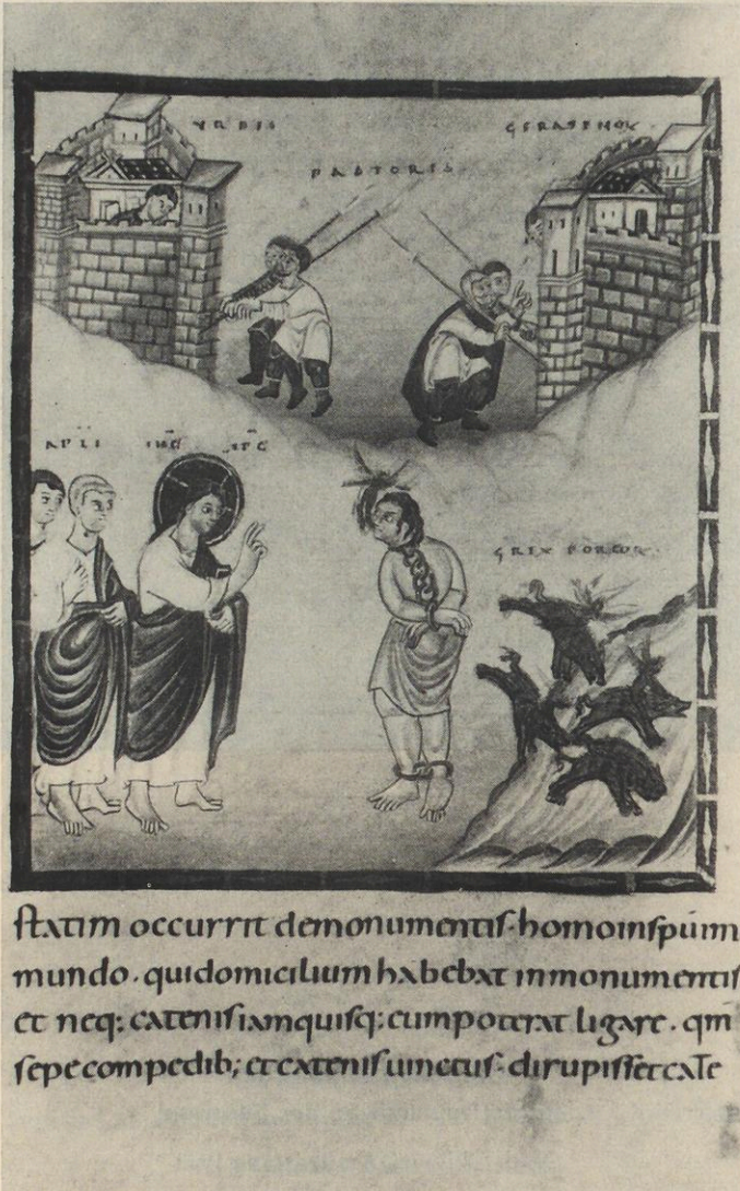
Trier, Stadtbibliothek Egbert-Evangelistar: Heilung des Besessenen von Gerasa