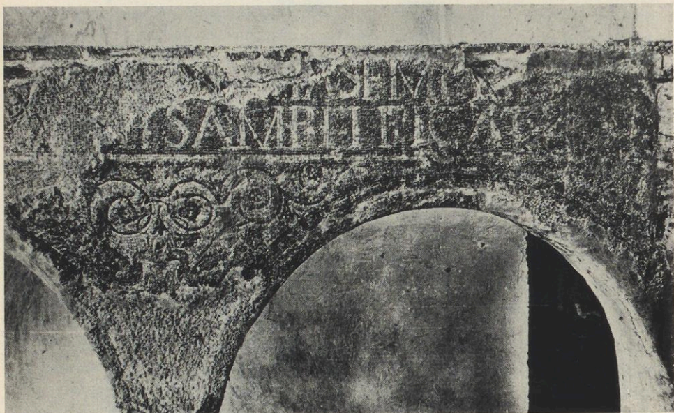
Cimitile, Felixbasilika Teilstück der Arkadenstellung um das Felixgrab („Ädikula“) Nach Chierici, Ambrosiana 1942