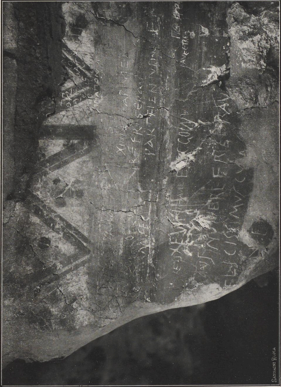
GRAFFITI SUL SECONDO MURO, METÀ SINISTRA