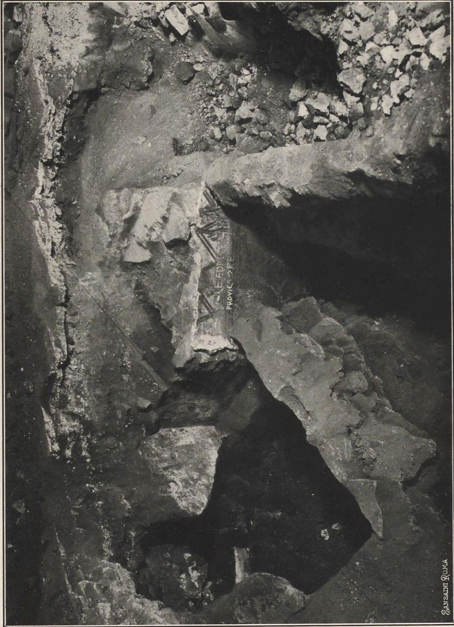
IL PRIMO MURO DEI GRAFFITI CON "FORMAE" ADERENTI