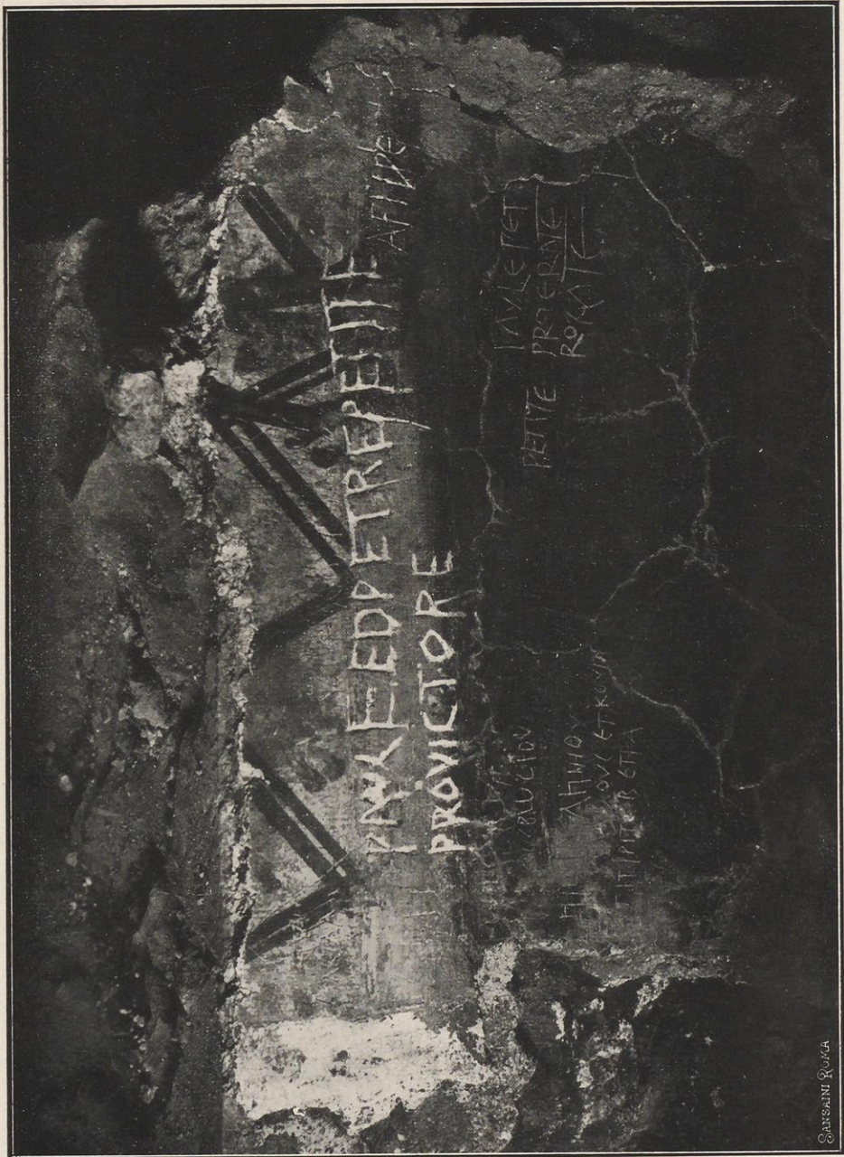
IL PRIMO MURO LIBERATO DALLE "FORMAE"