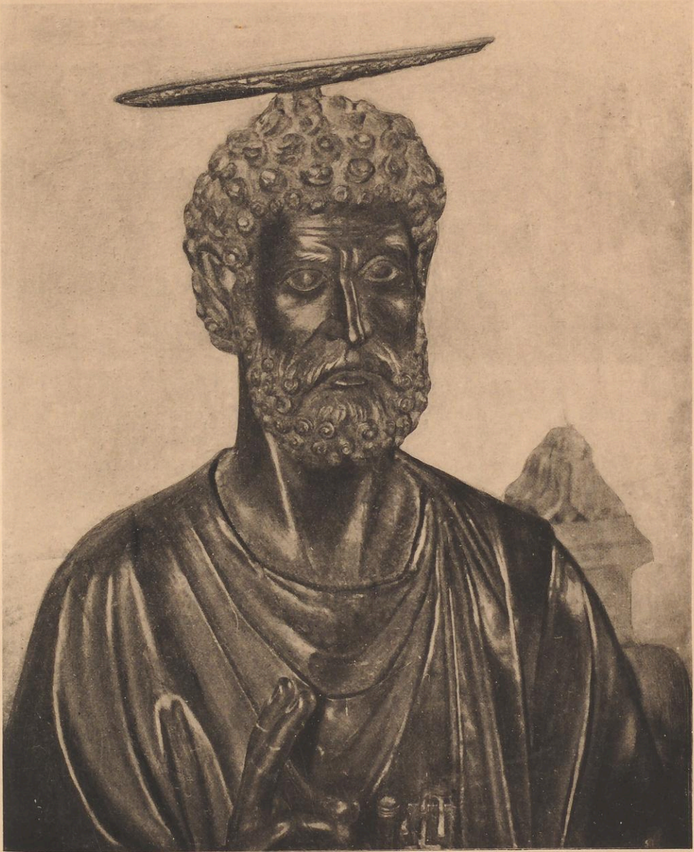
DANESI - ROMA

Zu dem Aufsatz: „Eine neue Aufnahme der Bronzestatue des Apostelfürsten Petrus“ von Prof. Joseph Wittig.